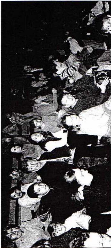
Le spectacle s'adressait autant aux adultes qu'aux enfants.